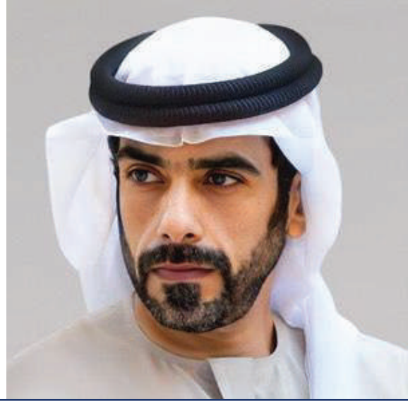
سمو الشيخ ذياب بن طحنون بن محمد آل نهيان رئيس مجلس الإدارة

ويشغل منصب نائب رئيس مجلس إدارة شركة أبوظبي الوطنية للتأمين، التي تعتبر الشركة الأهم في قطاع التأمين على مستوى الدولة، وتستحوذ الشركة على حصة سوقية هامة في الدولة بفضل ثقة العملاء بالشركة وأدائها وتنافسيتها.